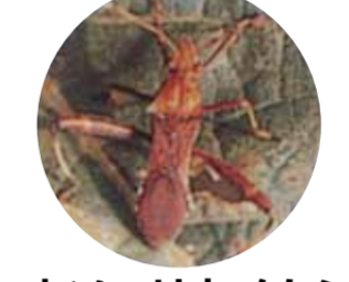
ホソヘリカメシ ※発生状況により 随時防除(右下表参照)