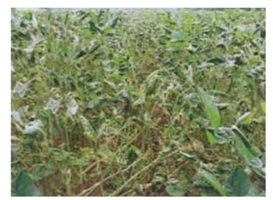
<ウコンノメイガ葉巻> 7月下旬に1本あたり平均葉巻数が6個以上の場合、防除実施