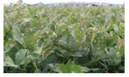
ハスモンヨトウによる食害。こうなる前に防除実施