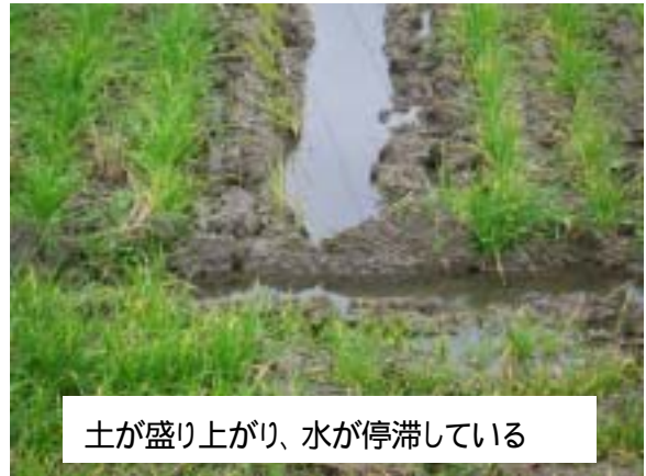
土が盛り上がり、水が停滞している