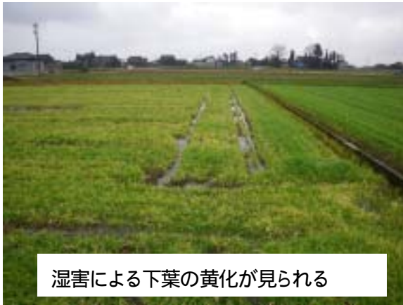
湿害による下葉の黄化が見られる

大麦の生育は概ね順調ですが、11月下旬からの降雨により、 下の写真のように湿害によって葉色が淡くなっているほ場が見られます。