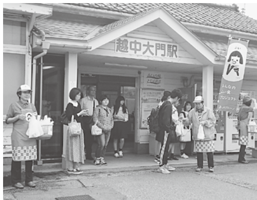
▲朝ごはん食べて、元気に行ってらっしゃい！！

9月27日(木)小杉駅前、小杉駅南、大門駅の3カ所所で7時30分から、通勤や通学する方へおにぎりを配る「朝ごはん食べよう運動」を実施しました。 私は、小杉駅南の担当だったのですが、「新米コシヒカリで作った美味しいおにぎりどうぞ」「できたてですよ」と、声を掛けながら用意した100個のおにぎりを20分余りで配り終えました。