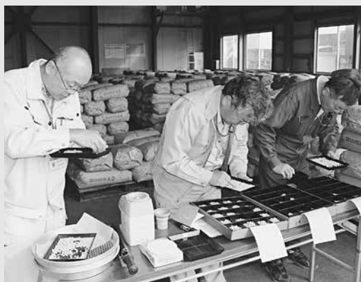
▲大豆の品質を検査する農産物検査員

平成30年産 大豆初検査 10月23日(火)、小杉大豆センターにおいて平成30年産大豆の初検査が実施されました。 この日検査を受けたのは10月初旬より管内で刈取りされたエンレイの1、034袋(紙袋・30kg)で、大粒大豆477袋は全量3等級となりました。品質は充実度・色沢・粒形・粒揃いは平年並み、百粒重は平年より軽い、紫斑病は見られず、汚損粒はほとんどないとのこと、総体的な品質は前年より良いという結果でした。 今後は適正な乾燥によるしわ粒の発生防止、並びに適正な水分の確保に努め、丁寧な選別・調整による良品大豆の生産に励んでまいります。 また、10月17日から収穫が始まるシュウレイも順次検査され、品質が期待されます。