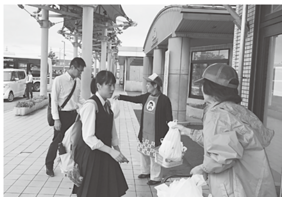
▲「新米のおにぎりどうぞ～」

9月27日(木)小杉駅前、小杉駅南、大門駅の3カ所所で7時30分から、通勤や通学する方へおにぎりを配る「朝ごはん食べよう運動」を実施しました。 私は、小杉駅南の担当だったのですが、「新米コシヒカリで作った美味しいおにぎりどうぞ」「できたてですよ」と、声を掛けながら用意した100個のおにぎりを20分余りで配り終えました。