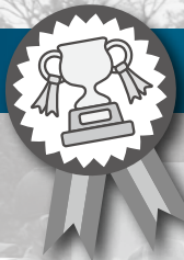
表 彰 式

Congratulations! Congratulations! Congratulations!