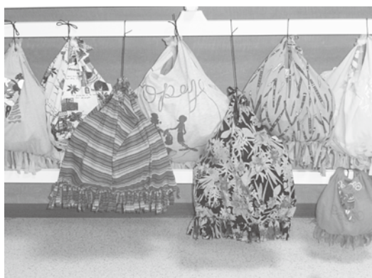
▲色とりどりのエコバックが出来ました。

1枚目は、30分ほどかかりましたが2、3枚Tシャツを用意していた方は、15分位でスイスイと作って仕上げておられました。素材は綿でもサラサラとしたポリエステル