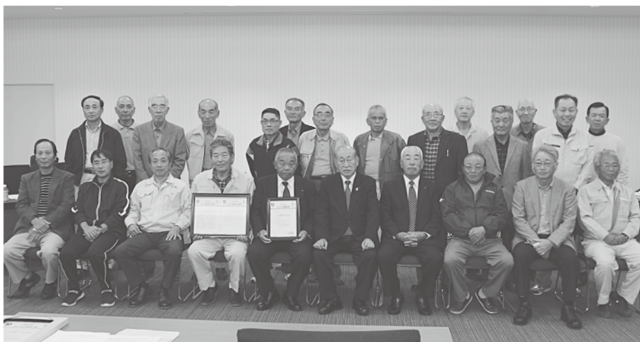
認証報告会に参加された、えだまめ部会会員代表の方々。