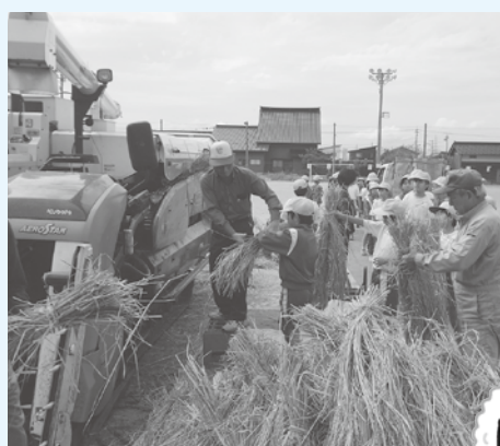
コンバインで脱穀します

また、11月2日(土)に地域感謝デーを開催します。これまで地域でお世話になった方々を招待して、ふれあい行事を行います。自分たちが作ったお米でおにぎりを作り、昼食を一緒に食べます。