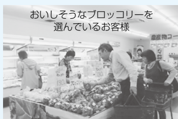
おいしいそうなブロッコリーを選んでいるお客様

今後は菜っちゃんでは、色々なイベントを企画していますので、菜っちゃんの掲示板等でご確認下さい。