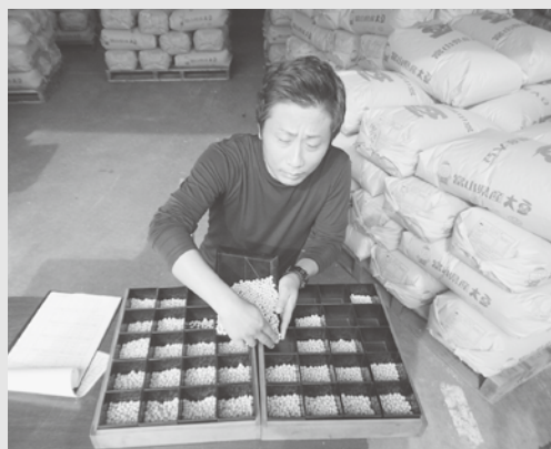
▲大豆の品質を検査する農産物検査員

今後は適正な乾燥によるしわ粒の発生防止、並びに適正な水分の確保に努め、丁寧な調整による良品質大豆の出荷に励んでまいります。