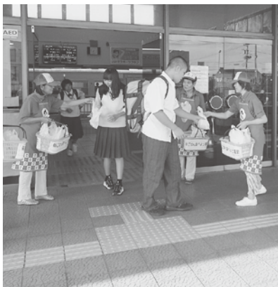
朝ごはん食べよう運動 小杉駅

二口支部は大門駅の担当だったので、「新米コシヒカリで作った美味しいおにぎりどうぞ」「出来たてですよ」と声を掛けながら用意した100個のおにぎりを20分余りで配り終えました。さて、子供達はちゃんと朝ごはんを食べて登校しているのでしょうか?生活リズムを改善する「エンジェル」があります。その名も「ハヤネリン」「ハヤオキナ」「アサタベルモン」これは先日、北日本新聞に掲載されていたコラムです。改めて、生活リズムを見直し、エンジェル達が、いつも子供達に舞い降りてくるようにしなければなりません。おにぎり1個から朝ごはんを、しっかりと摂るという習慣、大切さを痛感