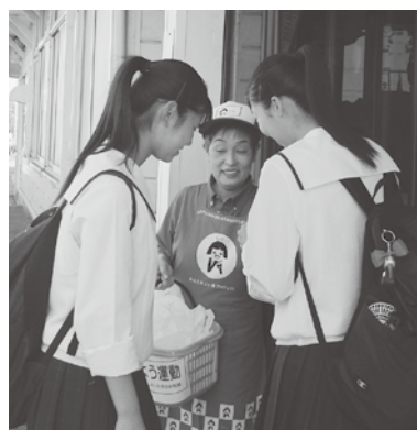
朝ごはん食べよう運動 大門駅

しました。今回も「愛菜グループ」の皆さんには早朝から300個のおにぎり作りをして頂きました。昆布とりのりで作られた新米コシヒカリのおにぎりは、正に元気の源です。少しばかりでも、その元気を皆さんに届けられた活動でした。そして早朝から運動に参加して下さった皆さん、本当にお疲れ様でした。(二口支部)