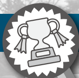
表 彰 式

Congratulations! Congratulations! Congratulations!