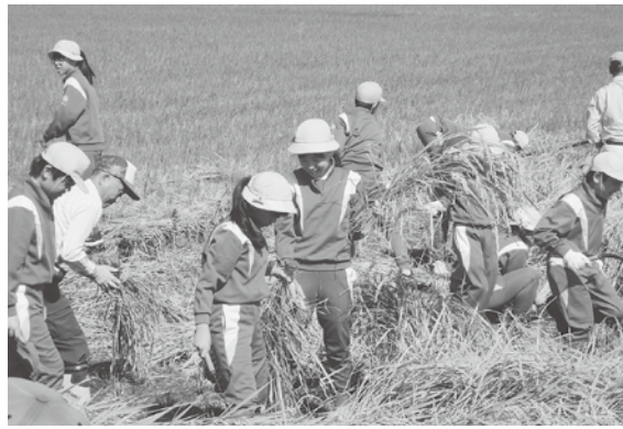
みんなでやると楽しいね☆

9月27日(金)、片口小学校の学校田(土田彰さん提供)で稲刈り体験をしました。これはもう20年余りになる5年生の米作り活動で、春に種をまき、秋には刈り取りをしています。また、田植え・稲刈りは全て昔ながらの作業でやっています。この地区は、水郷地帯で刈り取った稲を舟(たづる、いくり)で運び、とねりこの木と呼ばれて