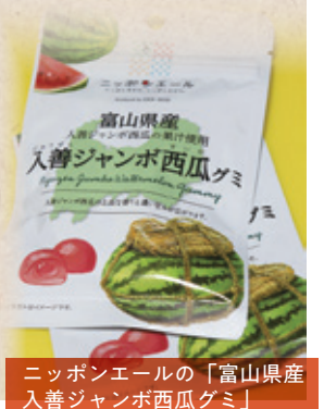
ニッポンエールの「富山県産入善ジャンボ西瓜グミ」