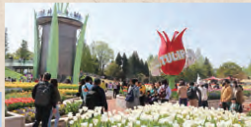
▲にぎわう「となみチューリップフェア」