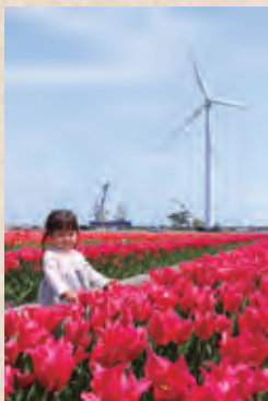
▲満開の花が鮮やかな「にゅうぜんフラワーロード」