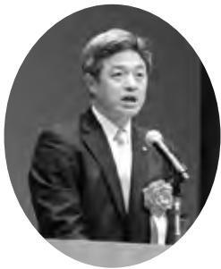
▲夏野 元志射水市長