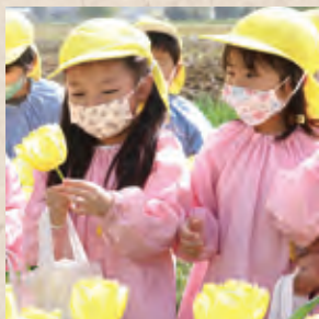
▲花摘みをする園児