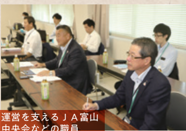
JA富山中央会などの職員が運営を支える