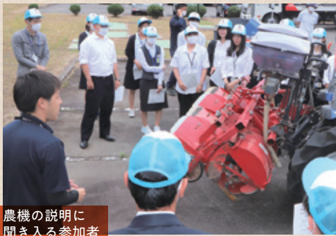
農機の説明に聞き入る参加者

たくさんの方が集まる場では、多くの人が「空気」を読んで発言をためらう。失敗したくないとか、つまらないことを言うやつだと思われて損をしたくないという「ケチくさい気分」に支配されがちで、目立つことをしたくない。