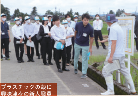
プラスチックの殻に興味津々の新人職員

たまま、まわりの人たちにおすそ分けするかのようになり、見せて回った。興味津々の様子で、純粹に学びを楽しんでいるように見えた。