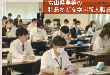
富山県農業の特長などを学ぶ新人職員

この研修は「富山県域担い手サポートセンター」連絡協議会が主催し、JA富山中央会や全農とやま、共済連富山、農林中央金庫富山支店の先輩たちが、協力体制を組んで運営した。日本農業新聞や家の光協会までもが応援に駆け付けるという手厚い布陣である。JAグループは研修体制がしっかりしているから、これから先もこのような機会はきっと何度も訪れる。失敗してあたりまえ。気前よく、じゃんじゃん質問しようではないか。