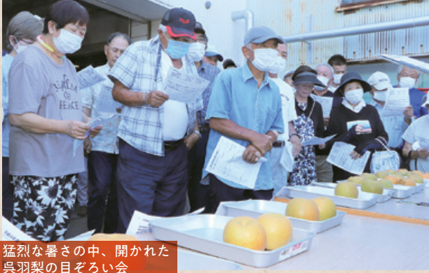
猛烈な暑さの中、開かれた呉羽梨の目ざろい会

呉羽梨の目ざろい会取材した日も、空調を止めたまま、窓ガラスを全開にしてJAなのはな梨選果場へと向かった。風が気持ちいいと少しばかり感じるのは、走っている間だけ。止まると灼熱地獄なのだが、五福あたりの交差点はどういうわけか混み合い、一寸ずりの状態になった。選果場に到着したころには、全身汗だくになっていた。