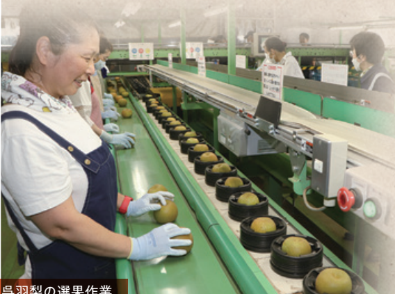
呉羽梨の選果作業

自分自身にそう言い聞かせながらも、「この先も毎年、暑い夏が来るのかもしれない」と思うだけで、うんざりするものである。