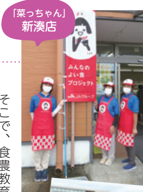
「菜っちゃん」新湊店

私たちは「炊き立てほかほかご飯」、「冷たくなっても美味しいおにぎり」、「お米を主食とした四季折々の豊かな実りを生かす食文化」を次の世代へも引き継いでいくようにしなければなりません。