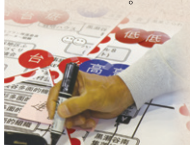
地域活性化に向けた「天気図」

特効薬は見つかりそうもないが、黒瀬谷の取り組みを取材し、明るい光が差すような思いがした。次世代のために何ができるのか。住民自らが挑むこうした取り組みを、応援していきたい。