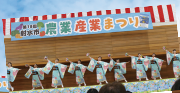
真美流星乱舞群 (しんびりゅうせいらんぶぐん) と 艶夜紗一 (えんやさー) による 迫力満点よさこいパフォーマンス