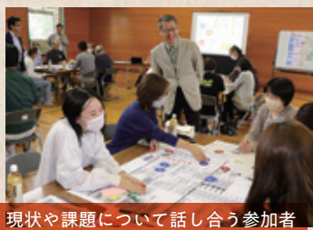
現状や課題について話し合う参加者

この地区ではUターンが増えるべき二十代前半、なかでも特に女性層が大きく減少してバランスを崩し、四歳以下が急減しているという。