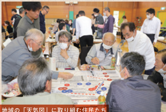
地域の「天気図」に取り組む住民たち

この日行われていたのは、農村型地域運営組織（農村RMO）の将来ビジョンをつくるワークショップである。富山県内ではいくつか取り