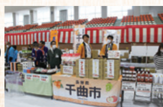
農産物品評会 受賞者の皆さん