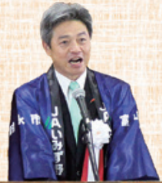
夏野名誉会長 (射水市長)