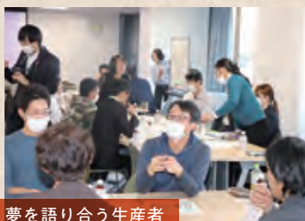
夢を語り合う生産者

続く伝統があり、実直な農家が心血を注いで栽培してきた。地中深くに肥料をやるこだわりの技術で、みずみずしく、ひげ根も少ない大根が生まれるという。きめこまかな肌質の「美人大根」としても知られている。