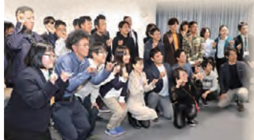
ワークショップを終えて記念撮影

今後、どんな野菜がブランド化されるのだろう。「感動を届けるドラマ」を見いだせるかどうか問われるはず。富山県が投じた「とやまテロワールベジ」という一石が、これからのような波紋を広げていくのか、楽しみに見守りたい。