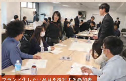
ブランド化したい品目を検討する参加者

富山県は今後も、県産野菜をブランドに加えていく方針だ。ブランド化には小堀さんも協力していて、若い生産者を集めた先日のワークショップでも講師を務めた。