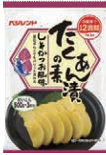
たくあん漬の素しそかつお風味

まず、『たくあん漬の素しそかつお風味』の試食。少量から冷蔵庫で漬けられ、手軽ながらも本格的な食感と味わいに感心しました。